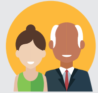
COLLÈGE DES PERSONNALITÉS QUALIFIÉES