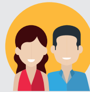
COLLÈGE DES HABITANTS