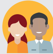
COLLÈGE DES ACTEURS ÉCONOMIQUES & ASSOCIATIFS