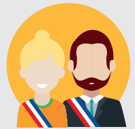
COLLÈGE DES ÉLUS